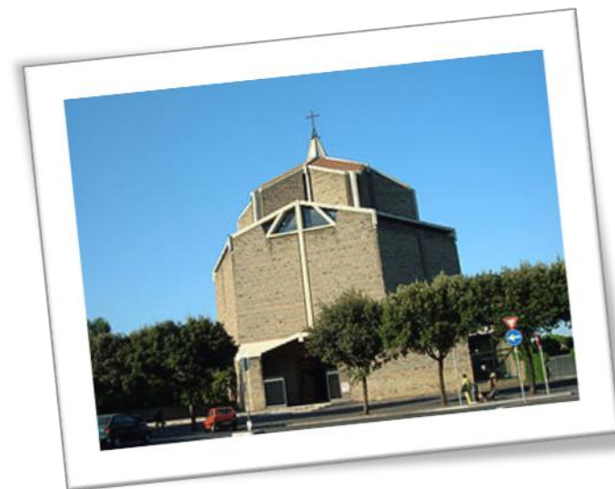
D.O.M. in honorem S. Polycarpus Smyrnaeus "in regione iuxta viam Tusculanam"